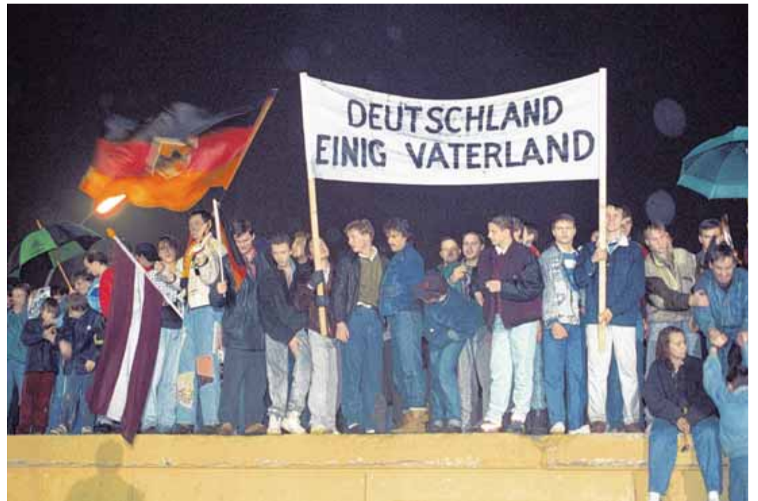
Auf der Berliner Mauer haben die Menschen 1989 ausgelassen das Ende der deutsch-deutschen Teilung gefeiert. Jetzt soll auch Wittlich ein Mauerstück erhalten.